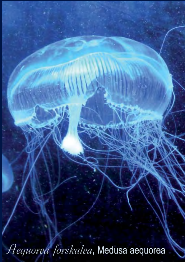
Aequorea forskalea , Medusa aequorea

Aunque las causas exactas de las proliferaciones de medusas son en la actualidad objeto de investigación, se sabe que estos aumentos son estacionales y han sido siempre un fenómeno natural. Tales proliferaciones parecen estar incrementándose en los últimos años, y se apuntan como causas más probables: la disminución de sus depredadores, como tortugas o atunes; cambios en factores climáticos, como el régimen de lluvias o la temperatura global (posiblemente asociados al cambio climático); peculiaridades hidrográficas, así como la contaminación procedente de fuentes terrestres.