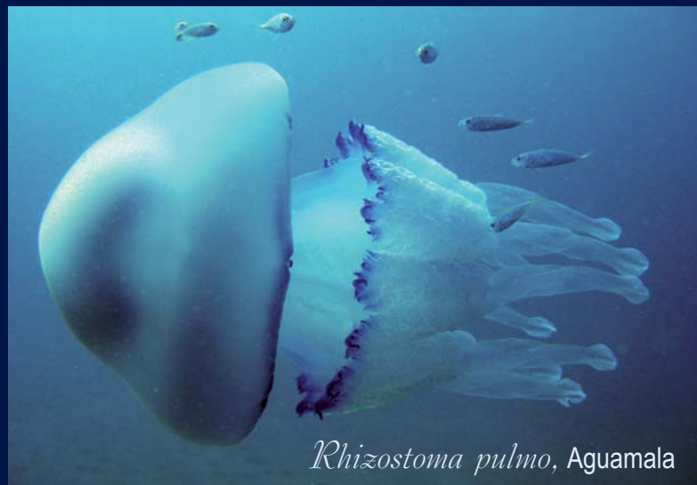
Rhizostoma pulmo , Aguamala