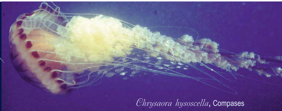
Chrysaora hysoscella , Compases