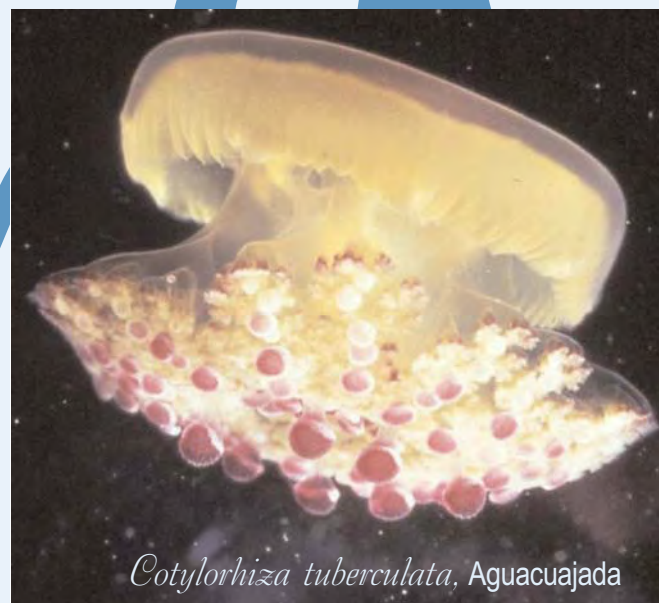
Cotylorhiza tuberculata , Aguacujada

El objeto de la Campaña Medusas es la vigilancia y avistamiento de la presencia de medusas en las costas españolas, no contemplando de forma generalizada la retirada de las mismas. Respecto a esto último, el Ministerio de Medio Ambiente, y Medio Rural y Marino, sólo actuará con carácter excepcional y en situaciones puntuales, de acuerdo a lo establecido en los protocolos de la Campaña.